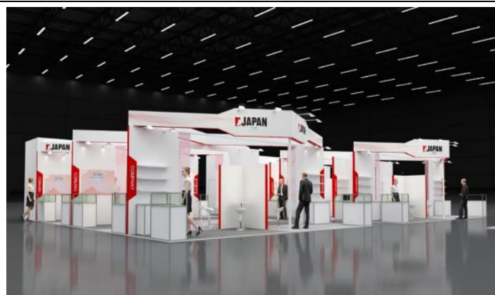
出展ブースイメージ（予定）

ジェトロ ジャパン・パビリオン仕様の基本装飾・備品（出展料に含まれるもの（個別ブース））：